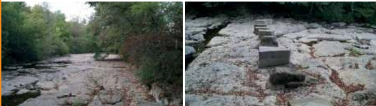
Imágenes del cauce del río Baías completamente seco.

Denbora luzea daramagu Zuian ur arazoekin. Bai kalitatea ez delako kontsumorako behar den bezain ona, bai udaro eskasia egoten delako. Hornidura sarean Udalak egin dituen inbertsioen ondorioz, asko hobetu da ur kalitatea. Urritasunak, aldiz, berdin jarraitzen du. Eta horrela segituko omen du: Eskumena duten erakundeek ez dute konponbide bat emateko asmorik 2021era arte.