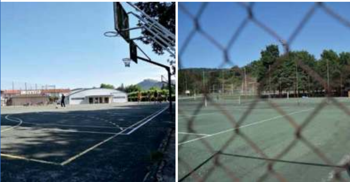
En la imagen de la izquierda el campo de baloncesto y futbito. En la de la derecha las canchas de tenis.

El Ayuntamiento ha solicitado la obra dentro del Plan Foral 2018-2019 de Diputación. A la espera de su respuesta, el presupuesto 2017 incluye una partida para elaborar el proyecto