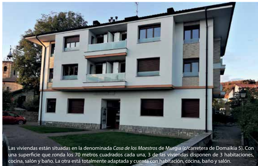
Las viviendas están situadas en la denominada Casa de los Maestros de Murgia (c/carretera de Domaikia 5). Con una superficie que ronda los 70 metros cuadrados cada una, 3 de las viviendas disponen de 3 habitaciones, cocina, salón y baño. La otra está totalmente adaptada y cuenta con habitación, cocina, baño y salón.

Señalar, por último, que la adjudicación se establece para un periodo de al menos 5 años.