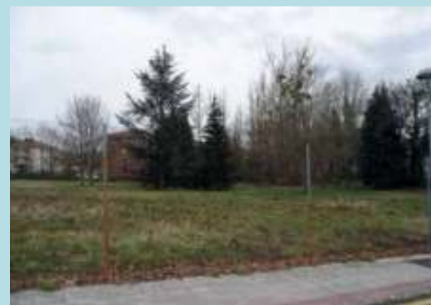
Osasun Zentro berriaren kokapena.

Gauzak horrela, eraikinaren kokapenak aldaketa jasan du, eta zentroa eraikiko da haritzen enborretatik gutxienez 15 metrotara. Erabaki hori, otsailaren 21eko bilkuran onartutakoa, Diputazioko Hirigintza sailak berretsi behar du. Artikulu hau irakurtzen ari zaren unean izapide hori gaindituta egotea espero dugu eta, horrela, Osakidetza obrei hasiera ematea. Aurreikusitako lanen epea 10 hilabetekoa da.